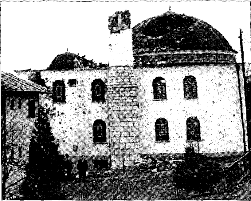
من صور همجية الصرب وعدوانهم في البوسنة

لكنييسة أخرى مثلها في مدينة « بريزن » .. فلم تكن سياسة العثمانيين الاستيلاء على الكنائس ناهيك عن هدمها . وحتى بعد أن تحولت الأغلبية العظمى من السكان إلى الإسلام في القرن السادس عشر تركت السلطات العثمانية الكنائس كما هي رغم أنها أصبحت مهجورة ، وقامت ببناء مساجد جديدة للمسلمين . فماذا فعل الصرب الأرثوذكس حديثاً بمساجد المسلمين في البوسنة ؟ كانوا يدكونها بالمدافع وتأتي « البلدوزارات » في اليوم التالي لتكنس أنقاضها وتسوى بها الأرض ، ومن أبشع الأمثلة على ذلك ما فعله الصرب في مساجد مدينة « بنيالوكا » ، كان بعضها من روائع الفن المعماري العثماني ، هدمها الصرب فلم يتركوا مسجداً واحداً قائماً ، وتحولت مواقعها إلى مواقف للسيارات ، وهكذا تحولت المدينة الإسلامية العريقة إلى مسخ مشوه .